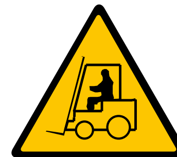
VEHÍCULOS DE MANUTENCIÓN