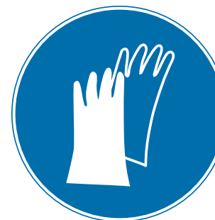
PROTECCIÓN OBLIGATORIA DE LAS MANOS