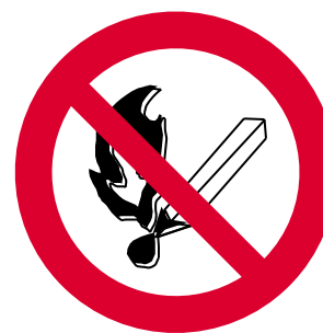
PROHIBIDO FUMAR Y ENCENDER FUEGO

“Con sindicatos el trabajo es más seguro”, y por ello, el desarrollo de la Estrategia Española de Seguridad y Salud en el Trabajo, en lo que se refiere a la actividad de los Agentes Sectoriales y Territoriales, como medio para que aquellos centros de trabajo que no tienen representación puedan asegurarse la implantación de la prevención de riesgos laborales, es imprescindible.